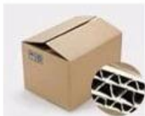
H. Seven layer Corrugated paper master carton