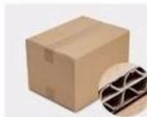
G. Five layer Corrugated paper master carton