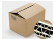
H. Seven layer Corrugated paper master carton