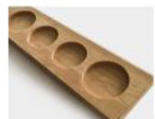
R. Wooden Pallet