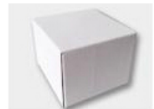
J. White Box