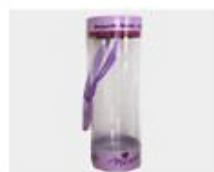
M. Pvc Box