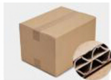
G. Five layer Corrugated paper master carton