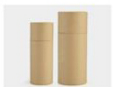
L. Paper Sleeve