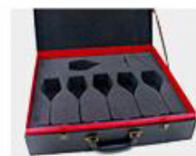
N. Gift Box