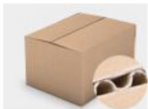
F. Three layer Corrugated paper master carton