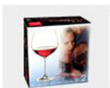
K. Color Box