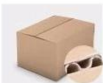
F. Three layer Corrugated paper master carton