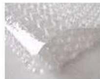
C. Bubble paper