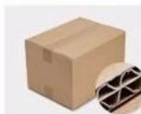
G. Five layer Corrugated paper master carton