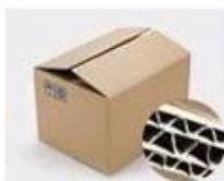
H. Seven layer Corrugated paper master carton