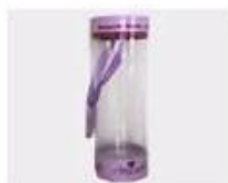
M. Pvc Box