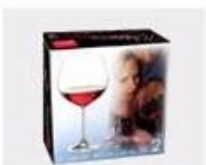
K. Color Box