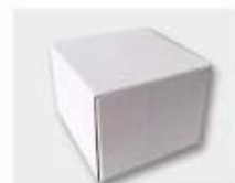
J. White Box