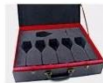
N. Gift Box