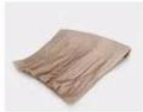
B. Corrugated paper