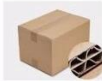
G. Five layer Corrugated paper master carton