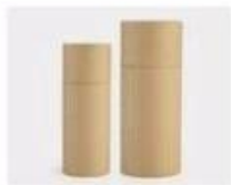
L. Paper Sleeve