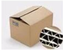
H. Seven layer Corrugated paper master carton