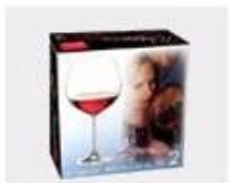
K. Color Box