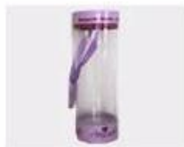
M. Pvc Box