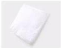
A. White paper