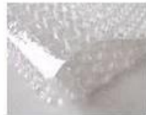
C. Bubble paper