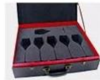
N. Gift Box