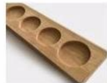
R. Wooden Pallet