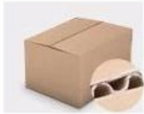
F. Three layer Corrugated paper master carton