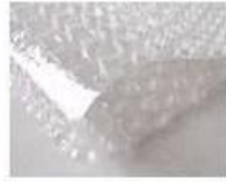
C. Bubble paper