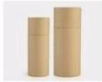
L. Paper Sleeve