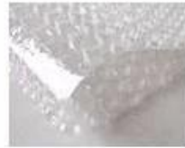
C. Bubble paper