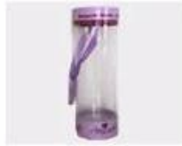
M. Pvc Box