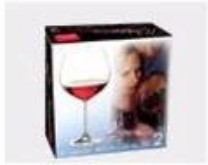
K. Color Box