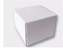
J. White Box