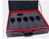
N. Gift Box