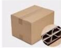
G. Five layer Corrugated paper master carton