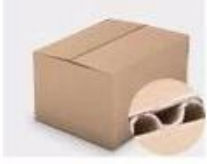
F. Three layer Corrugated paper master carton