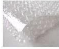
C. Bubble paper