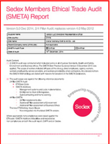
Sedex factory audit