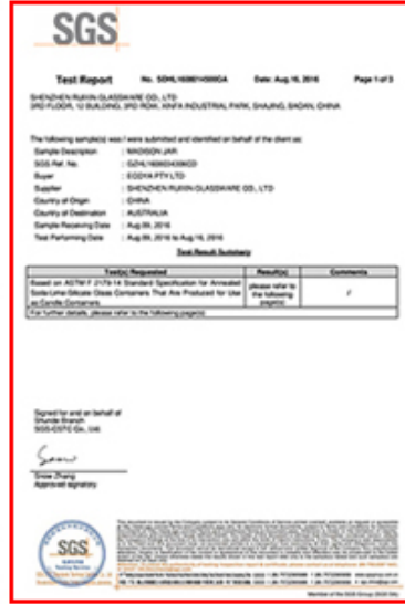
ASTM test report